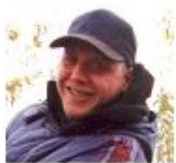
Pauliaus Korsako puslapis

Balandžio 25 - 29 dienomis paroda Miunchene, Vokietijoje medžiotojams, žvejams ir šauliams "MEDŽIOKLĖ IR ŽŪKLĖ. SPORTINIS ŠAUDYMAS" Miuncheno mugė "MEDŽIOKLĖ ir ŽŪKLĖ. SPORTINIS ŠAUDYMAS" vyks viename moderniausių pasaulyje parodų centrų. Tai - įspūdingas renginys, skirtas medžioklės, žūklės, sportinio šaudymo specialistams ir mėgėjams bei aplinkos apsaugos specialistams, gamtos mylėtojams. Jos metu bus prekiaujama naujaisiais medžioklės ir žūklės, šaudymo reikmenimis, rodomi medžiokliniai šunys, paukščiai ir pan. Išsami informacija apie parodą lankytojams ir dalyviams . Parodos programa: pasirodymai ir renginiai . Kelionę į parodą organizuoja turizmo agentūra "Kultūros bendrija". Informacija ir kelionės planas .