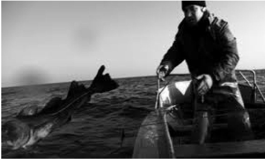
(XX a. 3 – 10 dešimtmečiai)

Nemuno ilgis yra 937 km., iš jų 462 km. upė teka per Gudiją ir 359 km. vingiuoja Lietuvos žeme, 17 km. upės yra siena tarp Lietuvos ir Gudijos, 99 km. – tarp Lietuvos ir Kaliningrado srities. 1919 – 1939 m. Nemunu tarp Juodosios Ančios ir Grovos žiočių (nuo 477,4 iki 432,7 km.) ėjo Lietuvos – Lenkijos demarkacijos linija, ir 200 m. upės pakrantės buvo draudžiamoji zona. 1939 m. rusams užėmus Lietuvą, dešiniajame Nemuno vidurupio krante stovėjo sovietų armija. Nuo 1920 m. iki Antrojo pasaulinio karo Nemunu nuo Šventupio žiočių iki Kuršių marių ėjo 112 km. ilgio siena su Vokietija. Nemunas buvo judrus tarptautinės prekybos ir sielių plukdymo kelias. Taigi vien mūsų amžiuje prie Nemuno gyveno ir jame žvejojo ne tik dzūkai, suvalkiečiai, aukštaičiai, žemaičiai, bet ir lenkai, gudai, vokiečiai, rusai. Tarpukario metais panemunių gyvenvietėse buvo daugybė šeimų, neturėjusių žemės ar jos turėjusių nedaug. Šioms šeimoms žuvų gaudymas ir realizavimas teikė lėšų pragyventi, o negandų ar bado metais – vienintelį šansą išlikti. Maistą žuvimis pajvairindavo ir pasiturinčios šeimos, o per pasninkus jas valgė visi. Žvejybą Nemune labai skatino tai, kad iki Antrojo pasaulinio karo Lietuvoje gyveno daug žydų, pagrindinių žuvų vartotojų.