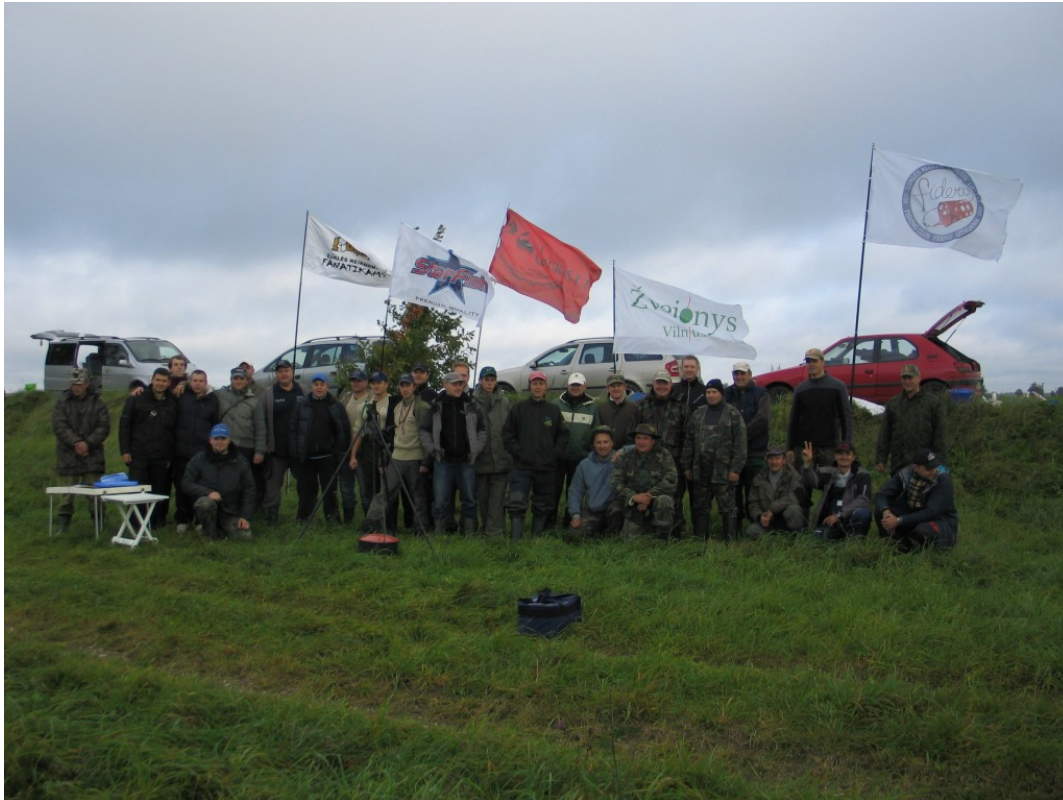
Lietuvos dugninės (feeder) čempionatas 2013m.

Parašė Lietuvos fydlerio lyga Pirmadienis, 25 Kovas 2013 18:04